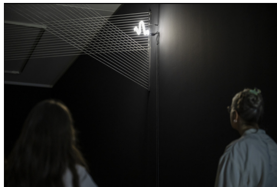
Ausstellungsansicht, Rosemarie Trockel / Thea Djordjadze.

limitation of life, Lenbachhaus, 2024.