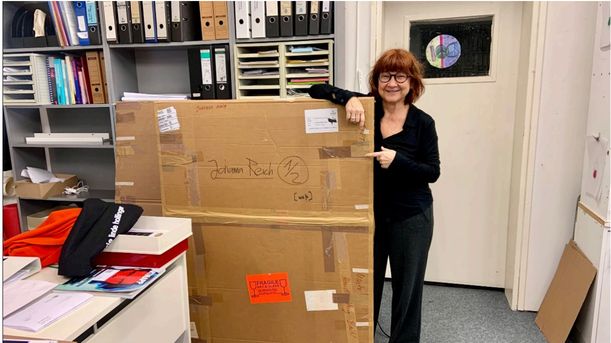
Silke packt ein.

frauenmuseum Kunst, Kultur, Geschichte e.V.