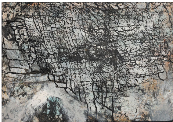
Chow Chung-chen, Ohne Titel, 1965