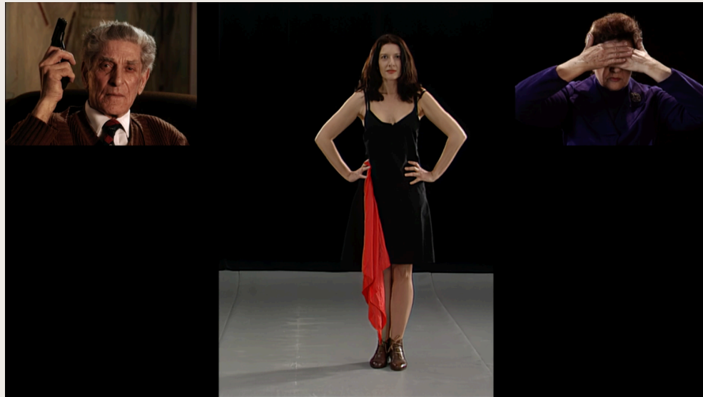
BALKAN BAROQUE, MARINA ABRAMOVIĆ, 1997

MUT, SELBSTLOSIGKEIT, ETHISCHE PRINZIPIEN; AUSDAUER, ENTSCHLOSSENHEIT, INSPIRATION sind die Kriterien der kuratorischen Annäherung an das Thema der Ausstellung