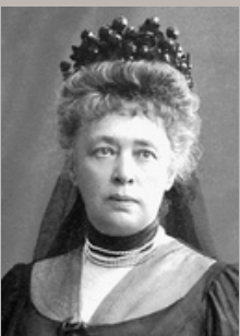
BERTHA VON SUTTNER