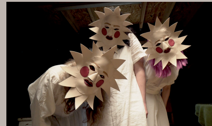
SWAN LAKE (VIDEOSTILL), PUSSY RIOT, 2023